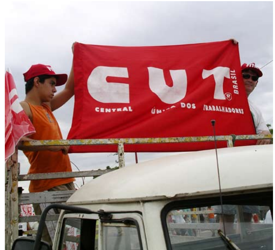
Utan kontakter med ett lands fackliga organisationer är det svårt att förstå vad som sker i arbetslivet. Fackliga företrädare ger ett annat perspektiv än företag och myndigheter.

»För miljontals människor i fattiga länder är facklig verksamhet enda vägen till inflytande över sin egen livssituation.«