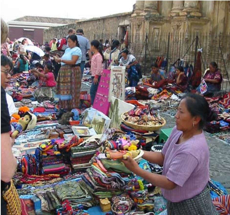
I flera länder är den offentliga sektorn svag, därför har fackföreningsrörelsen fått överta rollen som bildningsorganisation, som organisatör av fritidsaktiviteter och som informatör i sexualrådgivningsfrågor.

En snabb överblick av övriga länder i Latinamerika uppvisar stora variationer i fackliga villkor. I Argentina har den fackliga rörelsen CGT spelat en stor roll för den folkliga mobiliseringen mot IMF efter finanskrisen 2001–2002. De fackliga organisationerna samarbetar också med rörelsen för arbetslösa, piqueteros. Trots att den fackliga organisationsgraden har sjunkit de senaste