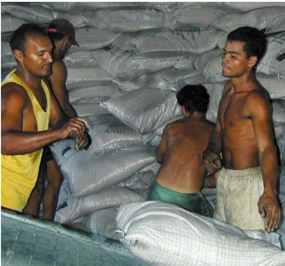
Många arbetsgivare och repressiva regimer upplever fackföreningarna som ett hot och kränker systematiskt de fackliga rättigheterna. I särskilt farligast är det att vara fackligt aktiv i Colombia