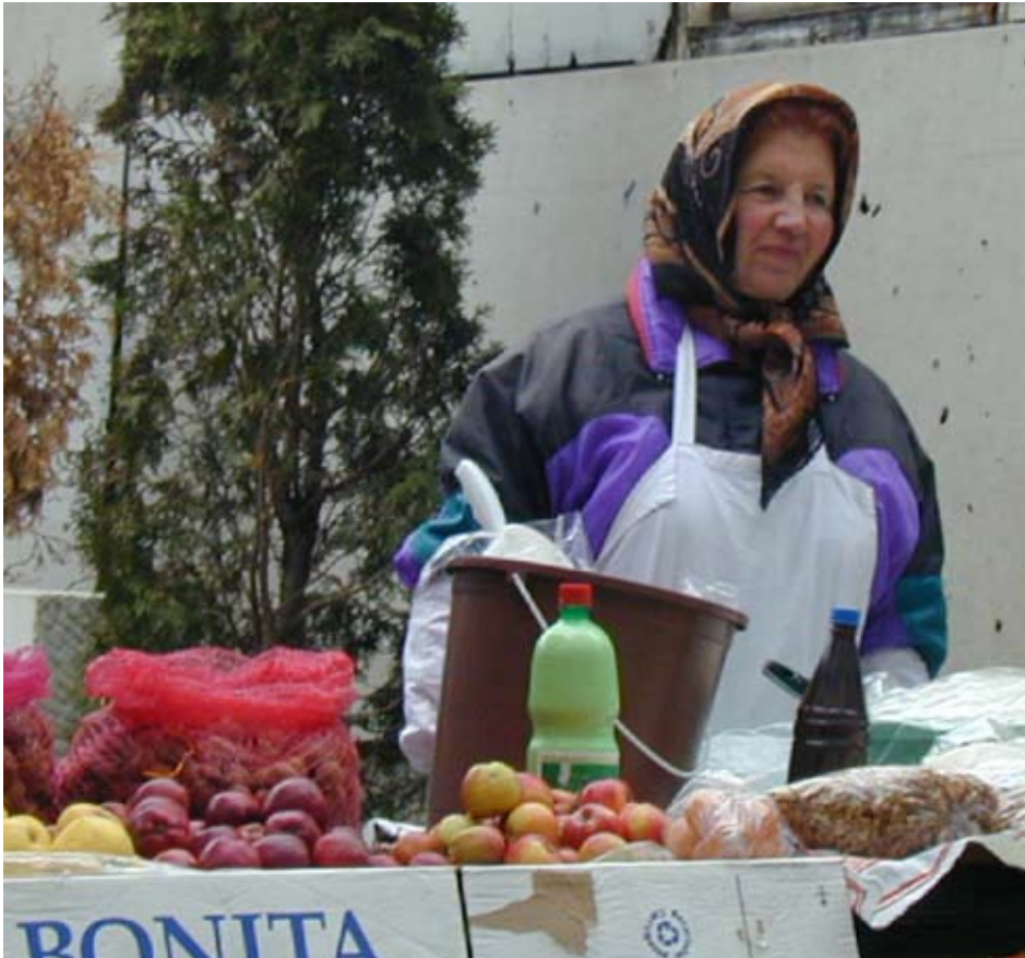
En avgörande fråga för de fackliga organisationerna är att återvinna förtroendet hos arbetstagarna. Ordet fackförening förknippas ofta med de gamla kommunistiska regimerna.