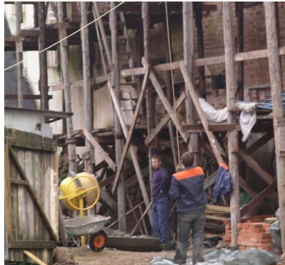
Utan kontakter med ett lands fackliga organisationer är det svårt att förstå vad som sker i arbetslivet. Fackliga företrädare ger ett annat perspektiv än företag och myndigheter.

»För miljontals människor i fattiga länder är facklig verksamhet enda vägen till inflytande över sin egen livssituation.«