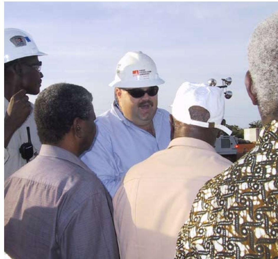
Utan kontakter med ett lands fackliga organisationer är det svårt att förstå vad som sker i arbetslivet. Fackliga företrädare ger ett annat perspektiv än företag och myndigheter.

»För miljontals människor i fattiga länder är facklig verksamhet enda vägen till inflytande över sin egen livssituation.«