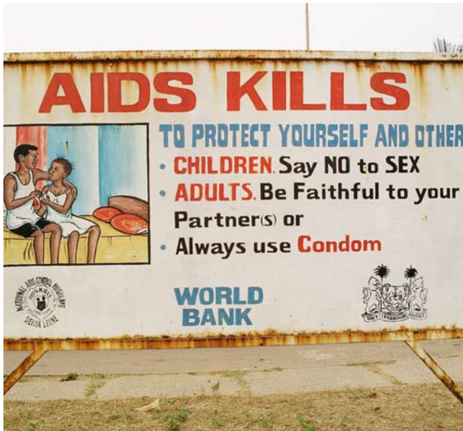
I brist på andra folkrörelser och en svag offentlig sektor har de fackliga organisationerna i flera länder blivit ledande i upplysningsarbetet för att till exempel förhindra spridningen av hiv/aids.